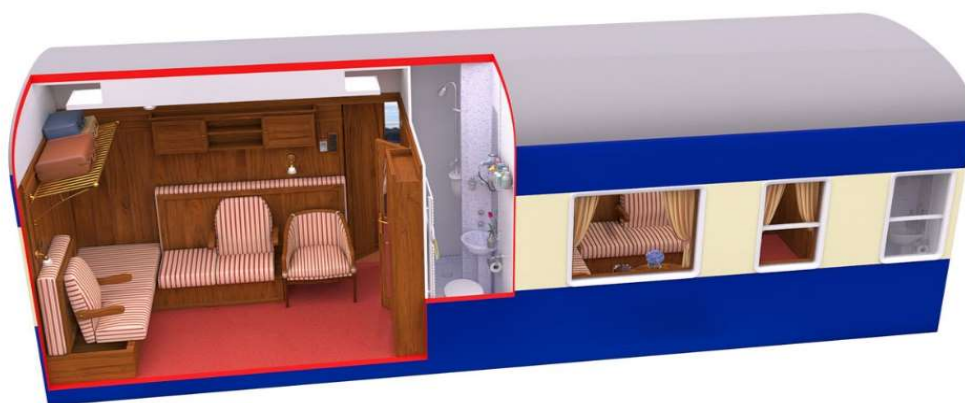
Vista Nocturna da Cabine Deluxe