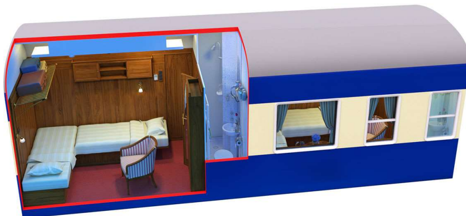
Vista Nocturna da Cabine Deluxe