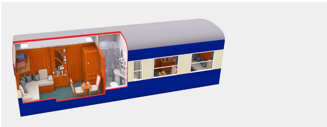
Vista Diurna da Cabine Deluxe Superior