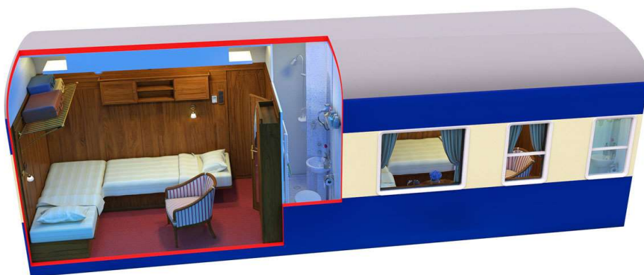
Vista Nocturna da Carruagem Deluxe