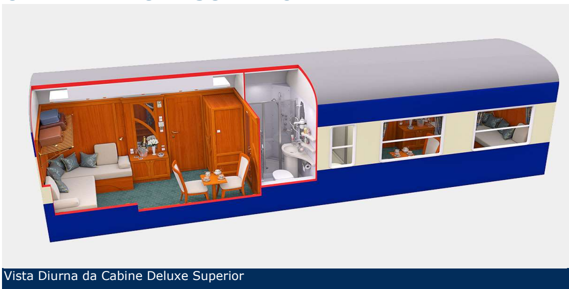
Vista Diurna da Cabine Deluxe Superior