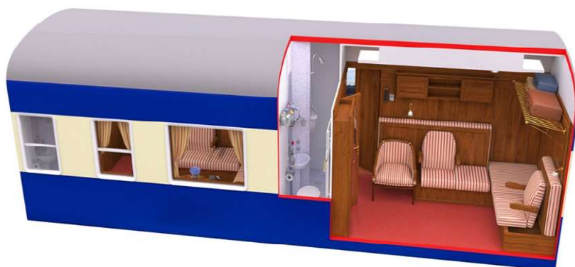
Vista Diurna da Carruagem Deluxe